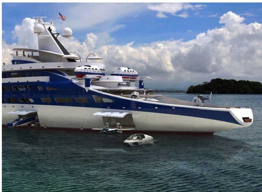
Deepseaker e un e-tender di lusso pensato per i proprietari di Superyacht

Approfittiamo del premio per avere notizie sul progetto: “Siamo in procinto di ultimare le pratiche burocratiche per l'erogazione del finanziamento Invitalia già deliberato. A Carrara presenteremo il progetto nell'area Start Up” . Sul lato pratico? “Stiamo facendo passi avanti sulla progettazione ingegneristica definitiva in modo da trovarci pronti per dare il via alla prototipazione , quanto prima” .